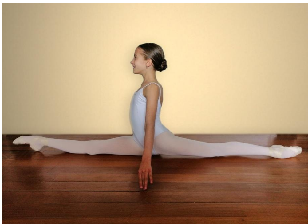
Imagem 5 – Perna da frente à escolha